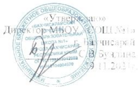
График работы школьного спортивного клуба «Сокол» на 2021-2022 учебный год.